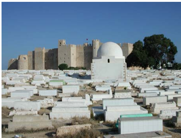
Ribat und Friedhof Monastir

Seit unserer Abreise aus Monastir am 19.9. und dem gestrigen Eintreffen in Palma liegen nicht nur rund 670 Seemeilen, sondern auch ein wahrer Kulturwechsel. Dort das geschäftige, oft laute aber sympathische <arabische> Treiben in der Medina, fremde Düfte nach Gewürzen und in dunklen Ecken und in Hafennähe auch nach Urin. Hier hat uns das westliche Europa wieder mit all seinen Vorteilen aber auch seinen Preisen...! Im Radio hat die tunesisch-arabische Musik dem internationalen Pop Platz gemacht,