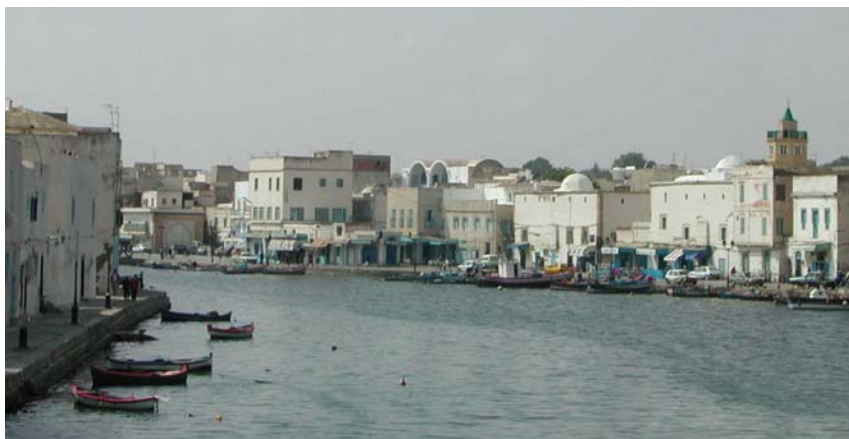
Bizerte alter Hafen