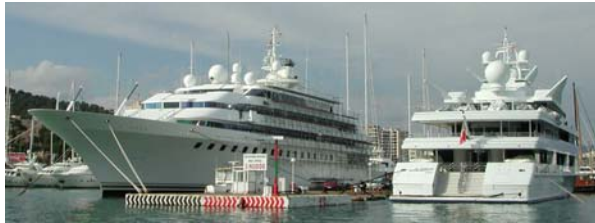
Privatyachten grösser als Bodenseeschiffe

Beim Einlaufen staunten wir über die hier vertäuten Megayachten und mussten im Vergleich dazu über unser eigenes Böttli etwas schmunzeln. Drei Beispiele gefällig?