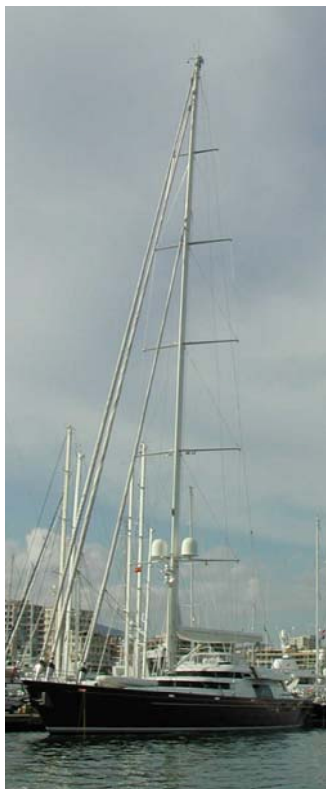
GEORGIA – bis vor kurzem die grösste einmastige Segelyacht der Welt