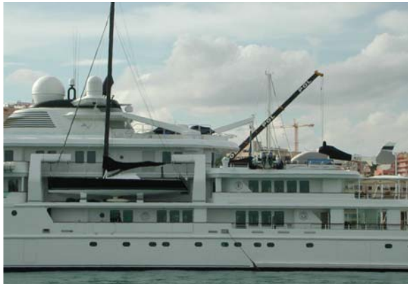
Die Spielzeuge Helikopter und Segelschiff (10m- etwa so gross wie unseres!) sind Immer dabei