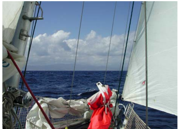
Sardinien in Sicht – Uff!

Kunststoffteil hätte dann jahrelang gehalten. Jedenfalls bin ich im Nachhinein auch froh um diese Erfahrung!