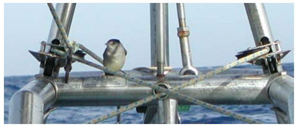
Mönchsgrasmücke – stimmmts?

Auf der wieder eher ruppigen Überfahrt (wir merken dass wir relativ spät dran sind – die Herbstwinde machen sich breit und unsere Hauptbesegelung ist die Fock und immer wieder Reffs im Gross) nach den Balearen haben uns noch 2 blinde Passagiere besucht: eine Mönchsgrasmücke und eine Schwalbenart haben sich im Cockpit niedergelassen. Die Grasmücke hat sich mit Käse, Brot, Banane und Wasser gestärkt nach einigen Stunden weiter auf den Weg gemacht.