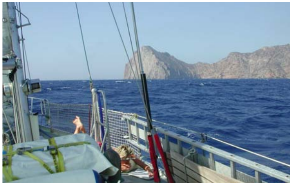
Cap Teulada – südlichste Spitze Sardinien

Die weitere Fahrt um die Südspitze Sardinien nach San Pietro war wunderschönes, schnelles Raumwindsegeln mit bis zu 8 Knoten Rauschefahrt und wohl als kleine Entschädigung für das Erlebnis zwischen Bizerte und Cagliari hat Neptun auch eine sicher 4-pfündige Dorade anbeissen lassen – einen der schmackhaftesten Fische! Schneller als es ihr lieb war, knallte unser Fischbetäuber auf ihr Hirn und schon bald landete der ausgenommene Leib im Kühlschrank, nicht ohne uns vor dem tödlichen Stich in den Kopf bei ihr zu entschuldigen. Aber schliesslich hat ihr niemand gesagt sie soll in die Plastik-Tintenfisch-Attrappe beiessen, oder? Und zudem brauchten wir kein schlechtes Gewissen zu haben, denn vorher hat zweimal ein wohl für unseren Silch zu grosses Exemplar glatt den Köder abgebissen!