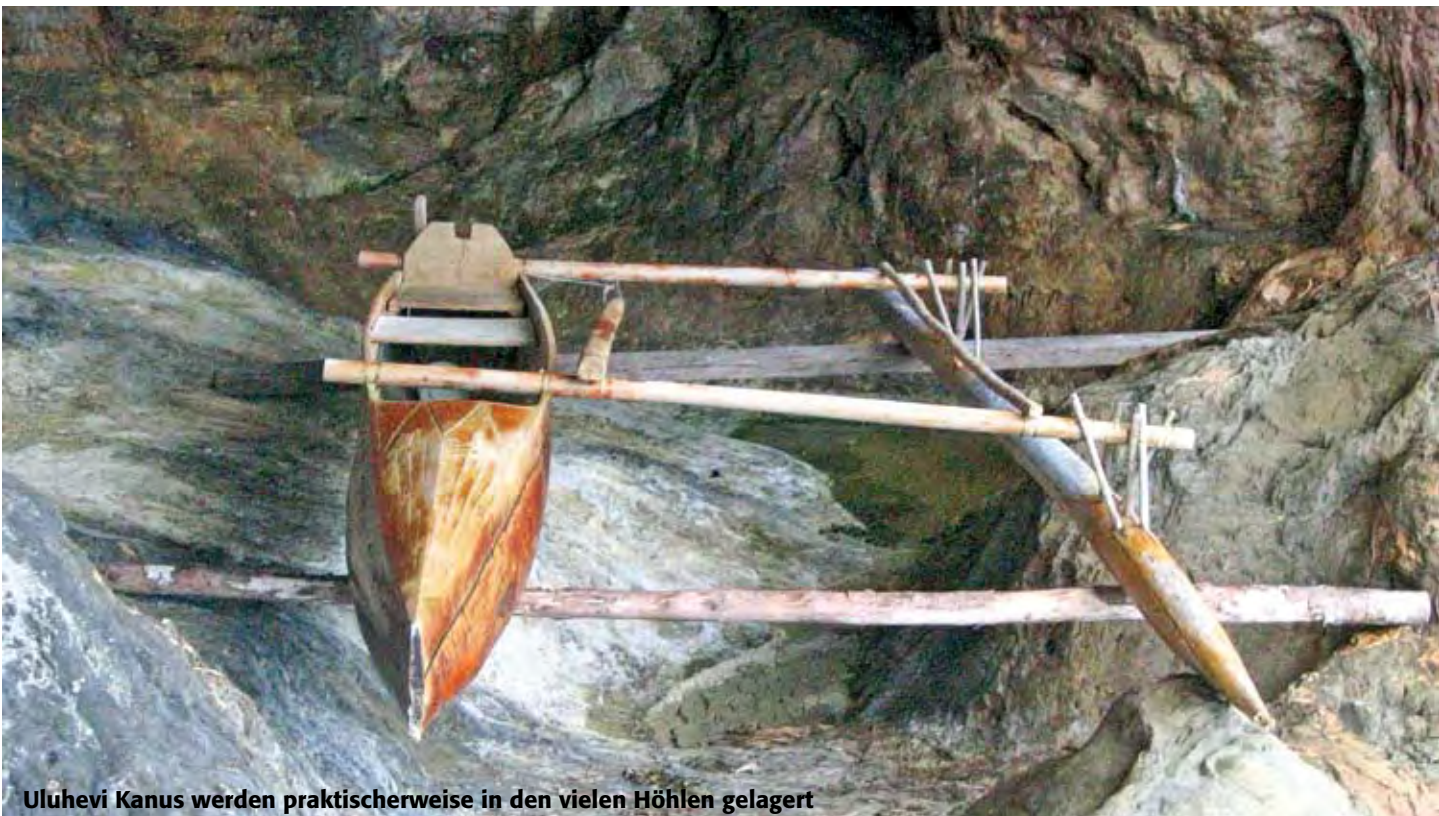
Uluhevi Kanus werden praktischerweise in den vielen Höhlen gelagert