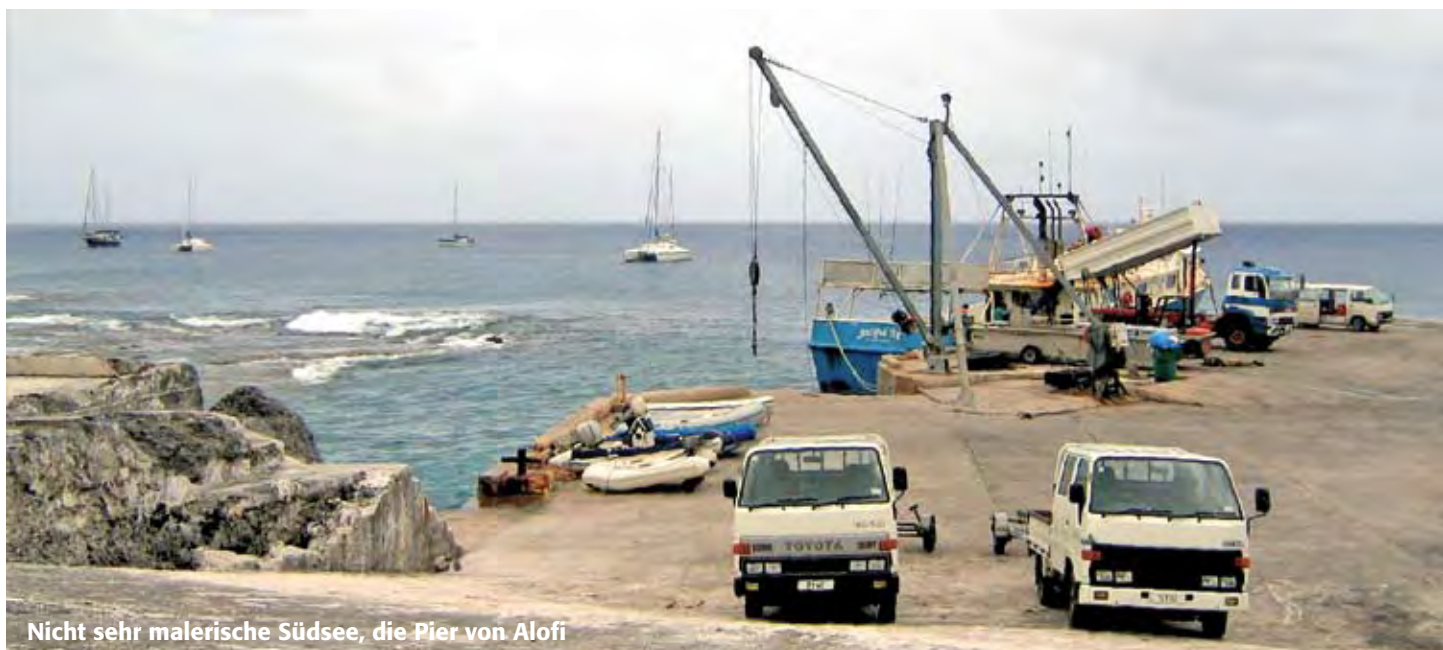
Nicht sehr malerische Südsee, die Pier von Alofi