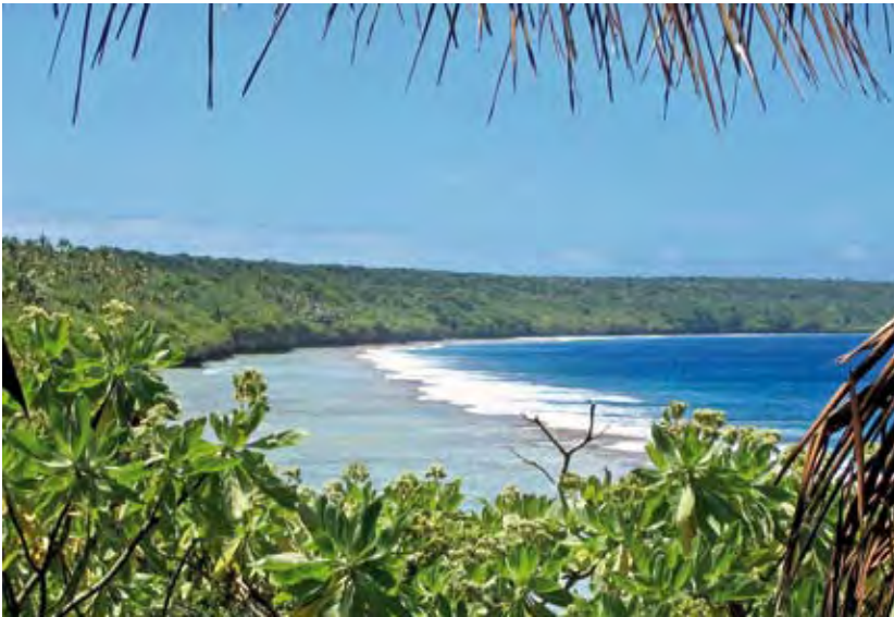
Die Südwestküste mit Blick auf das Matavai Resort