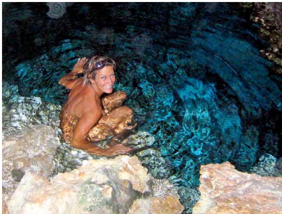
Das beste Bad der Welt, trotz der hochgiftigen Seeschlangen

und zu regnet es aus dunkelgrauen Wolken, welche jedoch durch den vorherrschenden Wind schnell wieder vertrieben werden. Wer Palmen, weiße Sandstrände und High-Life sucht, ist hier definitiv fehl am Platz. Für den abenteuerlustigen Individualisten wartet Niue dagegen mit unzähligen Felsgrotten, bizarren Höhlen und Spalten in den Kalksteinformationen auf. Diese sogenannten „Chasm“ bildeten sich bei der Hebung der Insel. Das flache Plateau senkt sich von rund siebenzig Metern am äußeren Rand bis zu