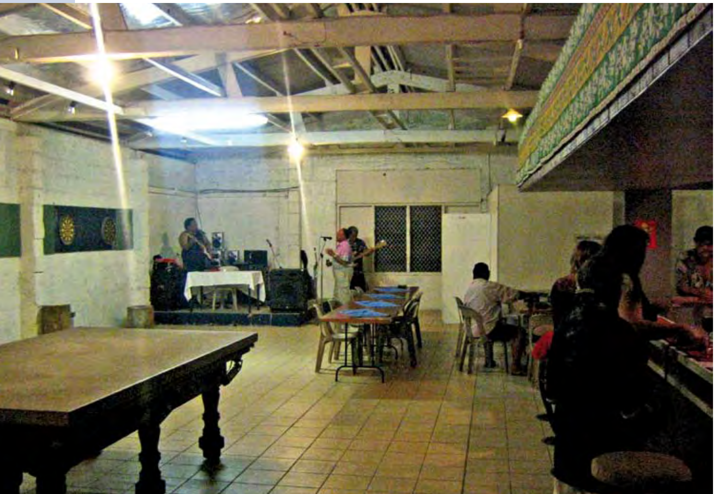
Pacific Way Bar

fenden. Wer so früh dran ist, hält sich vielleicht auch sonst nicht an die Statistik!