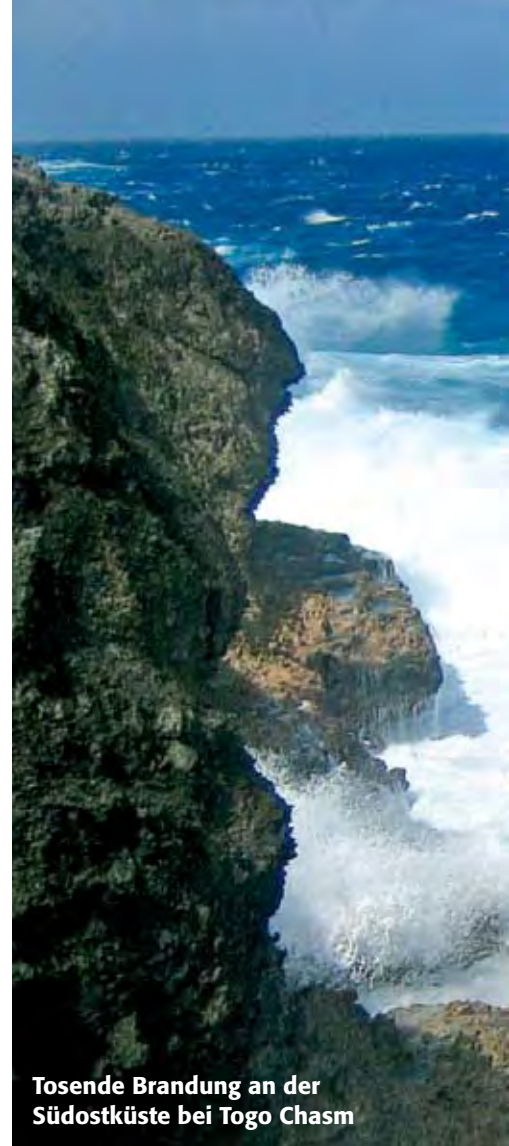
Tosende Brandung an der Südostküste bei Togo Chasm

„Es ist sehr schwierig für uns, die restriktiven Importbeschränkungen für landwirtschaftliche Produkte zu erfüllen“, erklärt Gaylene Tasmania vom Umwelt- und Landwirtschaftsministerium. Einzig Vanille und Noni erfüllen die Bedingungen, und auch nur, weil sie nicht als Pflanzen, sondern als getrocknetes