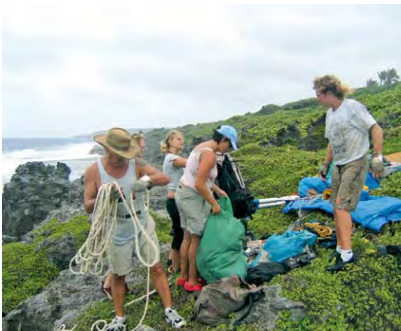
Wir halfen, so gut wir konnten

Niue liegt ziemlich abgelegen auf 19 Grad Süd und 169 Grad West, nahe der Datumsgrenze. 480 Kilometer sind es nach Westen bis Tonga, 930