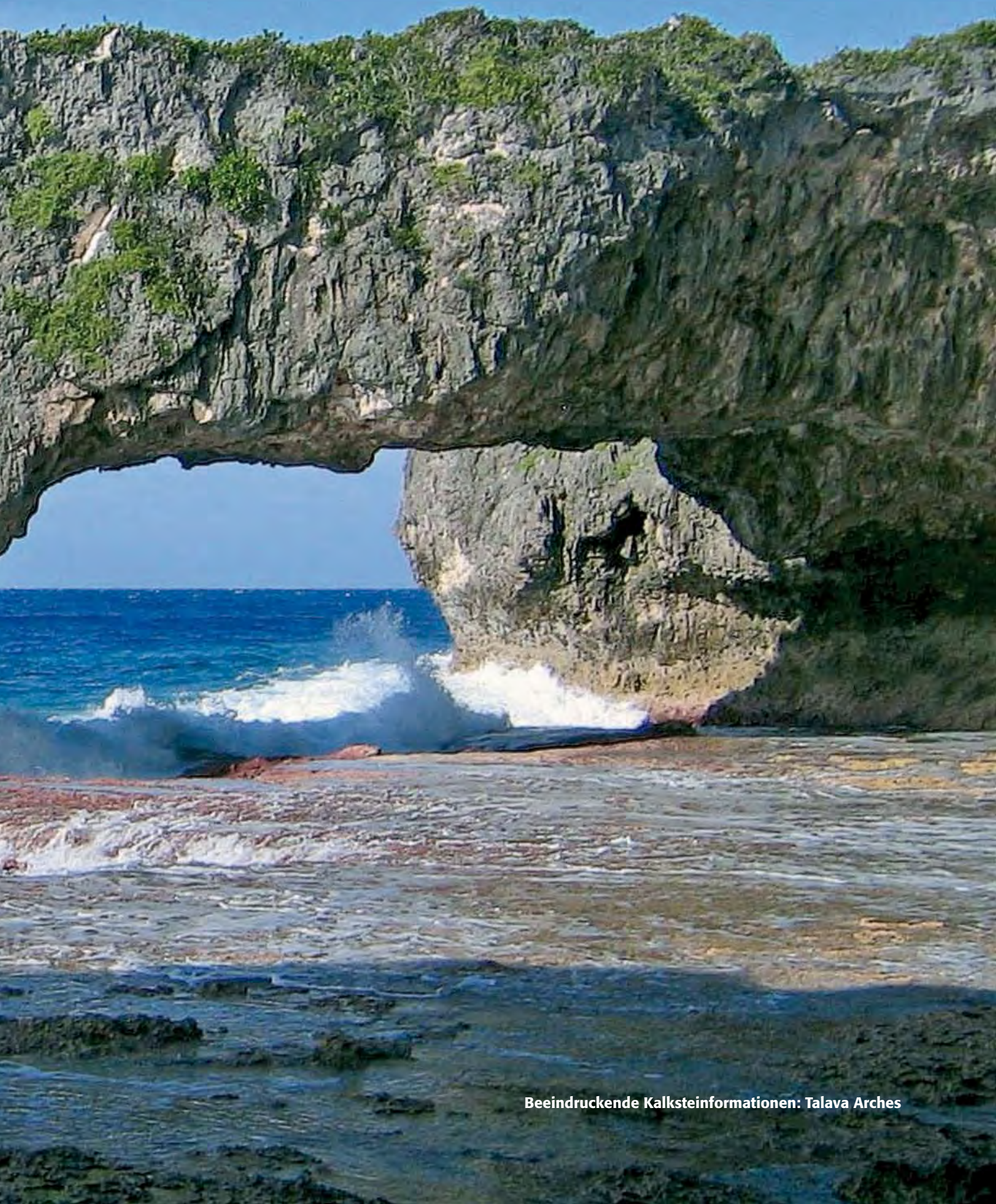
Beeindruckende Kalksteinformationen: Talava Arches