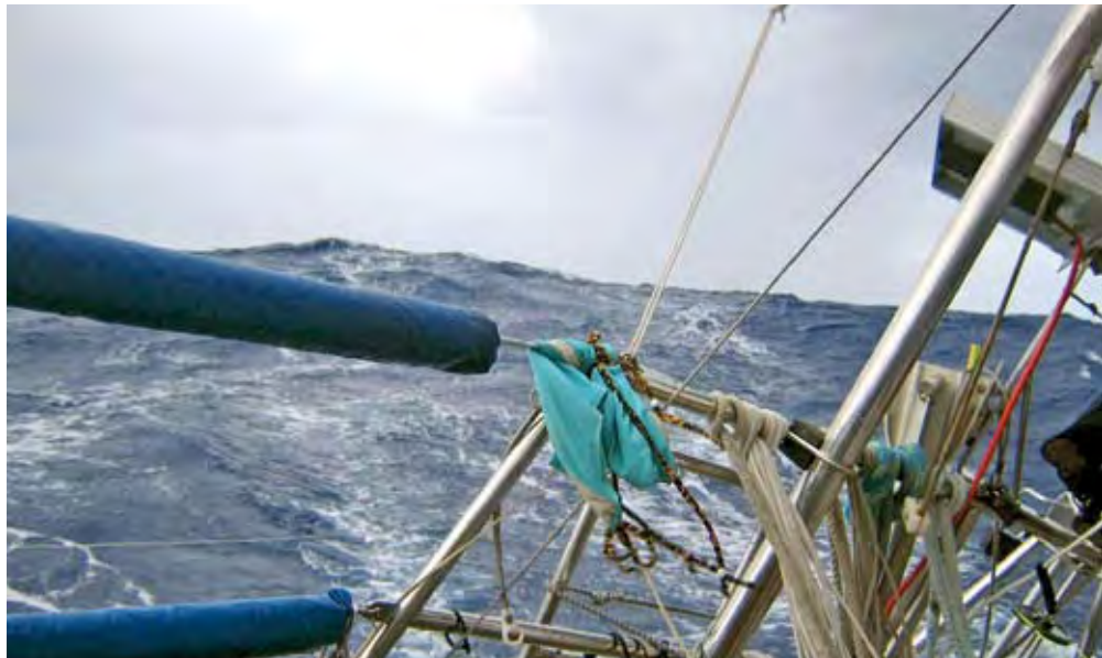
Heftig, heftig, die Passage nach Niue

Trotz „Constitution-Day“-Feierlichkeiten hofften wir, in „The Rock“, wie die Einheimischen ihre Insel nennen, noch einklarieren zu können. Nachdem unsere Bemühungen, die versehentlich durch den Motorraumlüfter entladene Starterbatterie zu überbrücken, an einem defekten Kabel scheitern, sind wir gezwungen, die Mooringboje unter Segeln anzulaufen. Wir nehmen das von der sportlichen Seite, sind aber trotzdem froh, dass nur gerade drei Bojen belegt sind. Über UKW-Kanal 16 nehmen wir Kontakt auf mit Niue Radio und bitten um Erlaubnis, am frühen Nachmittag für die Formalitäten an Land gehen zu dürfen. Wir werden aufgefordert, erst mal bis vierzehn Uhr standby zu bleiben. Gegen drei teilt uns die nette Stimme von Niue Radio mit, sie könne den zuständigen Beamten leider nicht erreichen, er sei auf