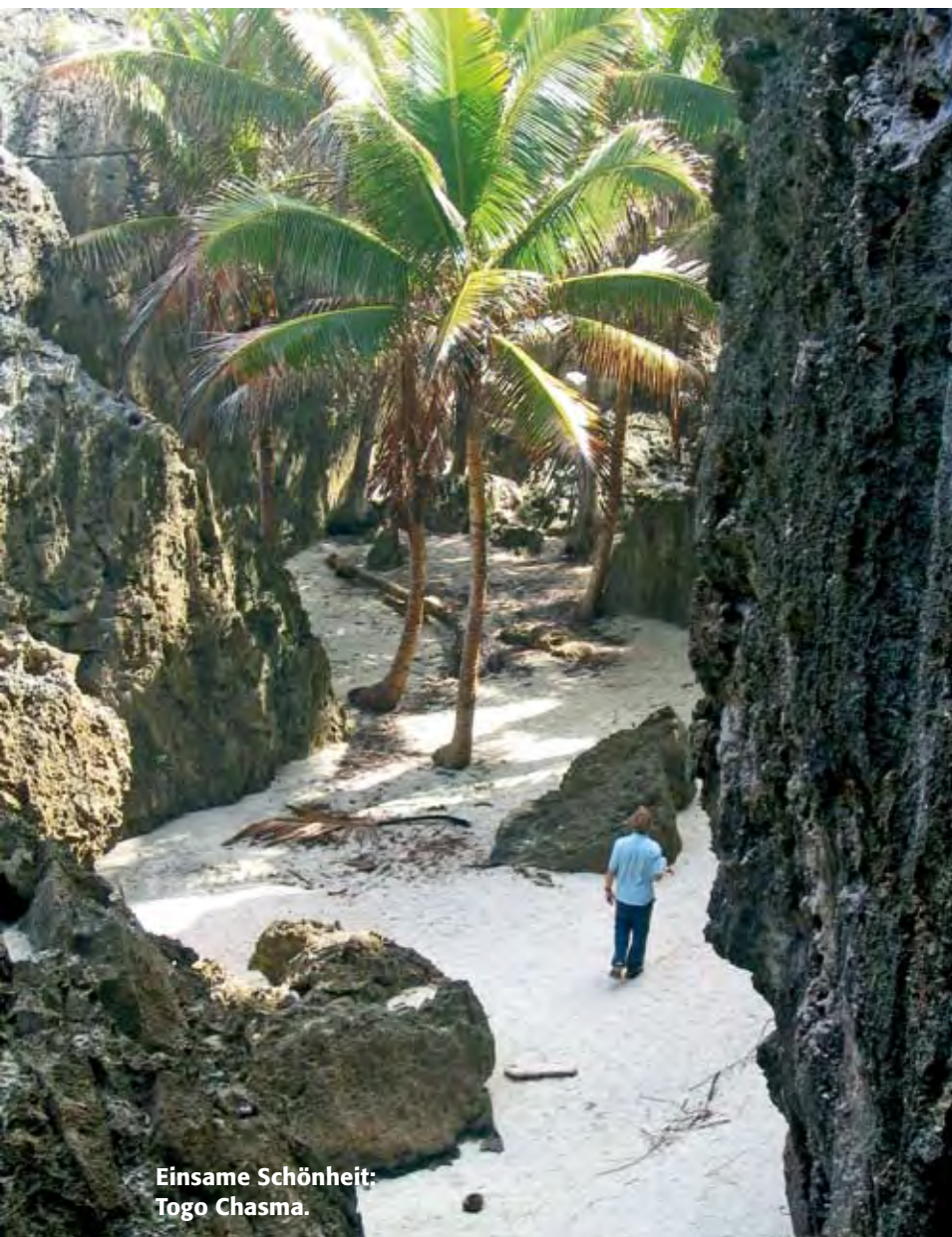
Einsame Schönheit: Togo Chasma.

Seit vier Tagen schon bildet sich über Vanuatu der erste tropische Sturm dieser Saison, Xavier. Seit gestern, dem 22. Oktober, ist es offiziell ein Hurrikan und seine Zugrichtung Südost, Richtung Fidji und Tonga. Für morgen werden im Zentrum 95 Knoten vorhergesagt. Eigentlich sollte er nach Süd und später nach West abdrehen. Auch wenn wir in Niue von Xavier noch sehr weit weg sind, sorgt dieser in den nächsten Tagen in unserer kleinen internationalen Seglergemeinschaft für Anspannung und mehrmals täglich halten wir uns gegenseitig über die Wetterentwicklung auf dem Lau-